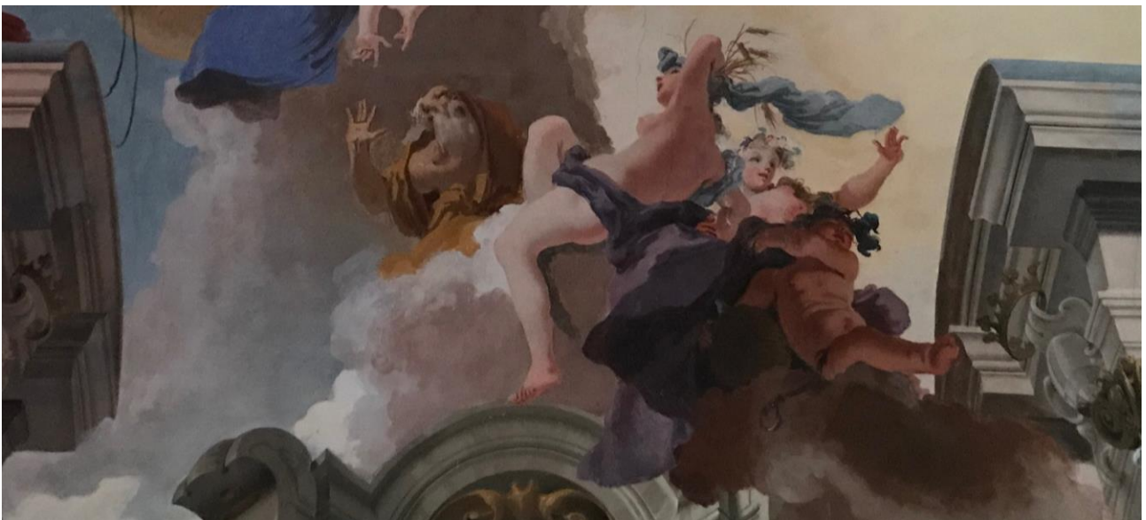
Da sinistra, l'Inverno avvolto nel mantello oca, l'Estate che si tiene con la mano la coroncina di spighe, dietro la Primavera con la corona di fiori sul capo, e infine il giovane Autunno con il mantello viola e i tralci di vite sul capo

Posizionate sotto alla caduta di Fetonte, ecco comparire le Quattro Stagioni, sconvolte dall'accaduto.