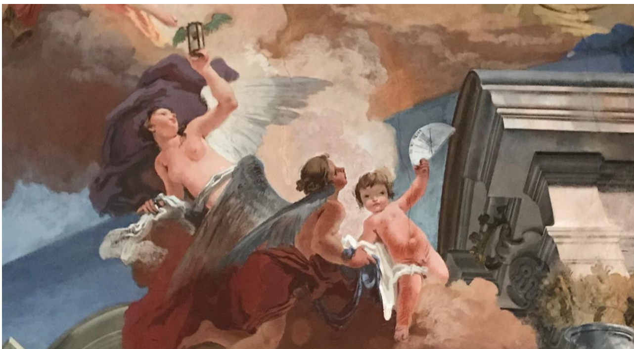
La clessidra e la meridiana, simboli dello scorrere del tempo

Nell'iconografia della sala vi sono ben tre elementi legati allo scorrere del tempo: una donna alata che tiene in mano una clessidra , un putto che regge una meridiana e soprattutto la figura anziana, posizionata sotto alla ruota del carro del Sole: ecco Saturno con l'inesorabile falce in mano, pronto a recidere la vita degli uomini al termine dei loro giorni.