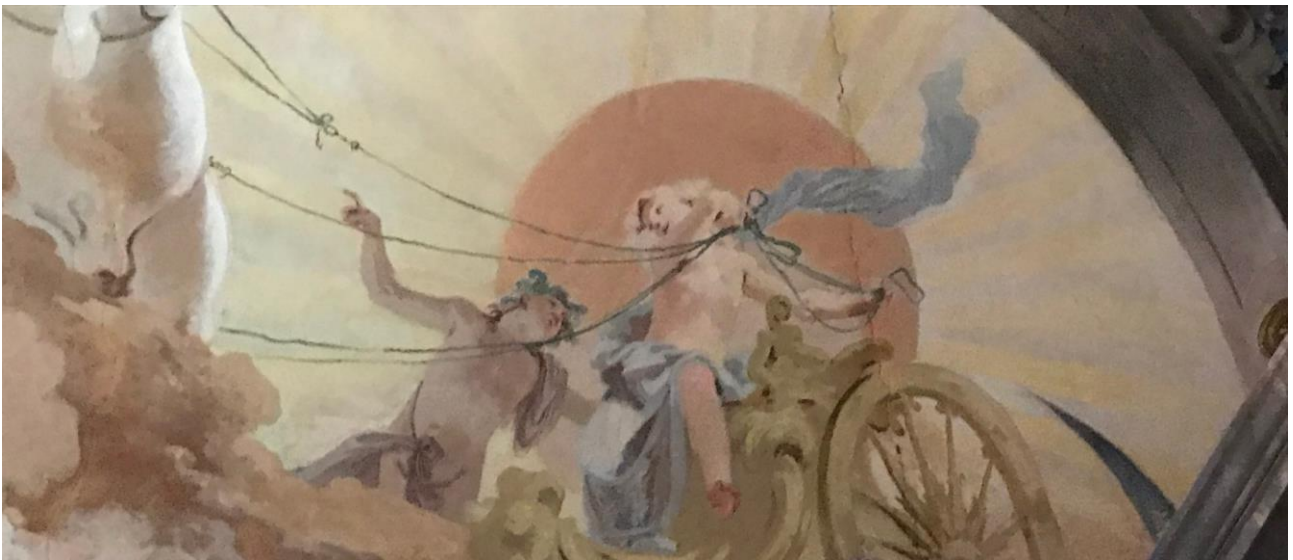
Fetonte, seduto sul carro, e accanto a lui il padre, Apollo, che gli indica come dovrà guidarlo (parete sud)

Le due scene principali dipinte sui lati sud e nord della sala, riproducono i momenti salienti del mito: l'inizio della storia, in cui Fetonte sale sul carro del Sole, pronto per iniziare la propria giornata "da dio"; e la scena finale della caduta.