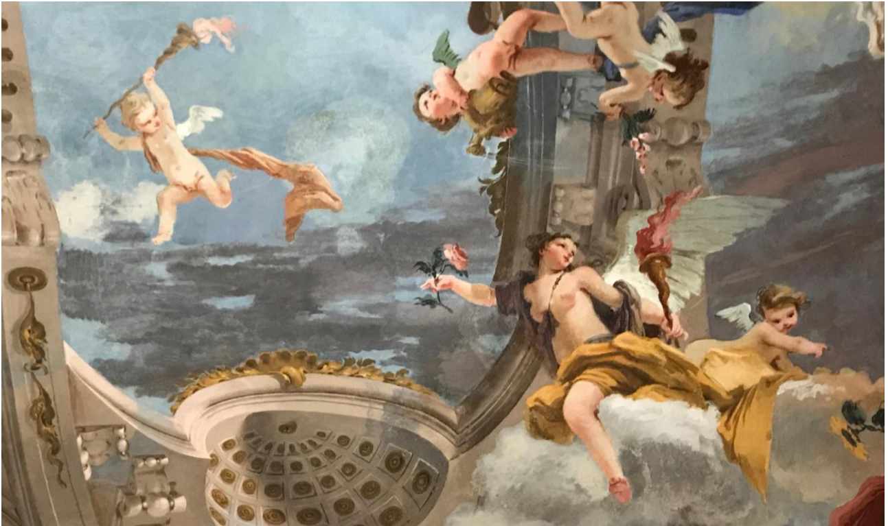
Sulla sinistra Lucifero, la stella del mattino, con la fiaccola accesa. Sulla destra l'Aurora, con la rosa e la fiaccola accesa. (parete est)

Posizionate sotto alla caduta di Fetonte, ecco comparire le Quattro Stagioni, sconvolte dall'accaduto.