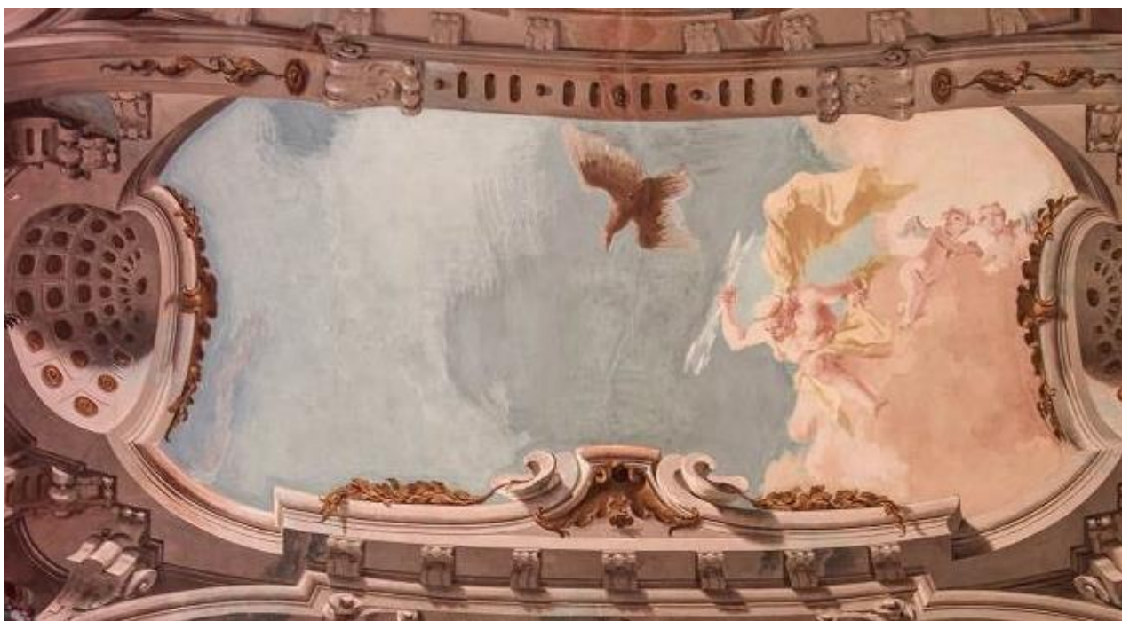
Zeus scaglia il suo fulmine contro lo sciagurato Fetonte per fermare la sua folle corsa (volta della sala)

Sulla volta della sala, vediamo Zeus riprodotto con l'aquila, suo classico emblema, nell'atto di scagliare un fulmine contro Fetonte, per fermare la sua folle corsa distruttrice.