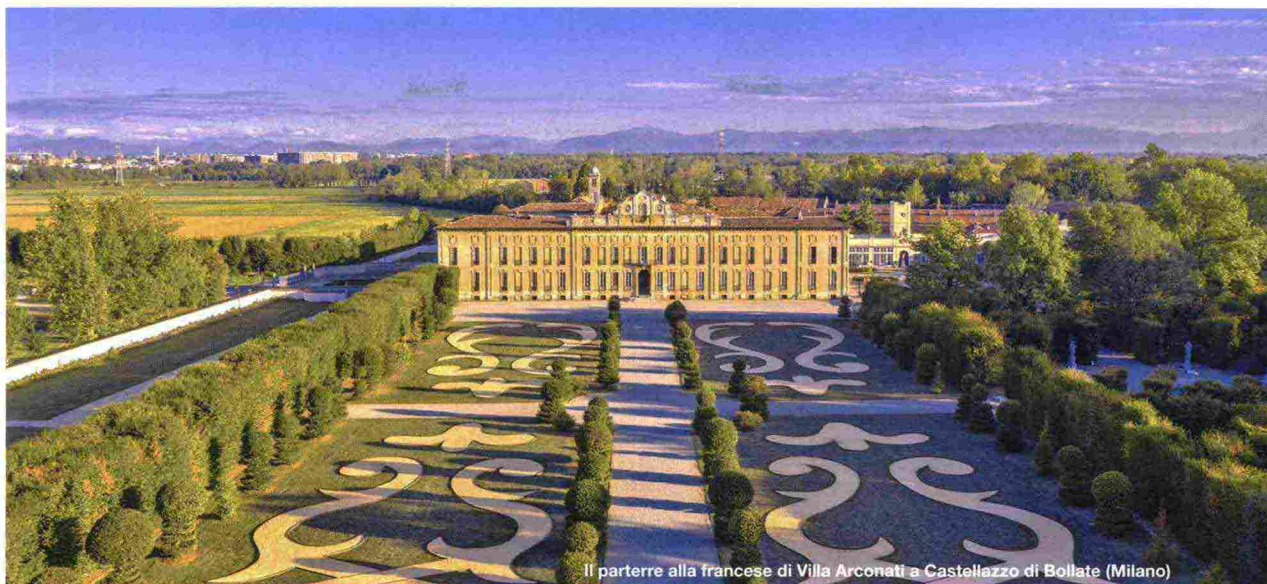
Il parterre alla francese di Villa Arconati a Castellazzo di Bollate (Milano)